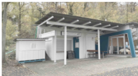
Planverfasser ... Göhner & Schrade Architekten GmbH Brettener Straße 49 75438 Knittlingen